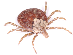
タカサゴキララマダニ雌成虫写真

アルファガル alpha-gal（ガラクトース-アルファ-1,3-ガラクトース galactose-alpha-1,3-galactose）は、大部分の哺乳類に存在し、ヒトを含む霊長類、鳥、魚、爬虫類には存在しない糖分子です。アルファガルは牛肉、豚肉、羊肉、牛乳、乳製品、ゼラチンなどに含まれています。